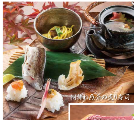
朝捕れ魚介の炙り寿司