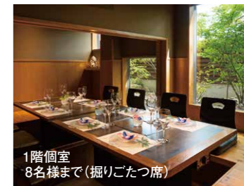
1階個室 8名様まで(掘りごたつ席)