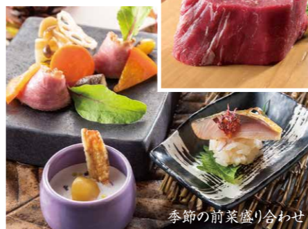
季節の前菜盛り合わせ