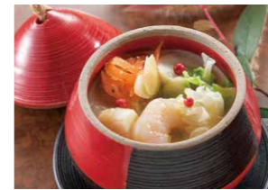
旬の野菜と魚介のゴロっとスープ