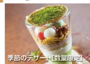
季節のデザート【数量限定】

数量限定 ※本プランは、シードカードポイントおよび、他の割引サービスの対象外となります。 特別溶岩焼き懐石