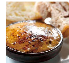
名物フオアグラ味噌